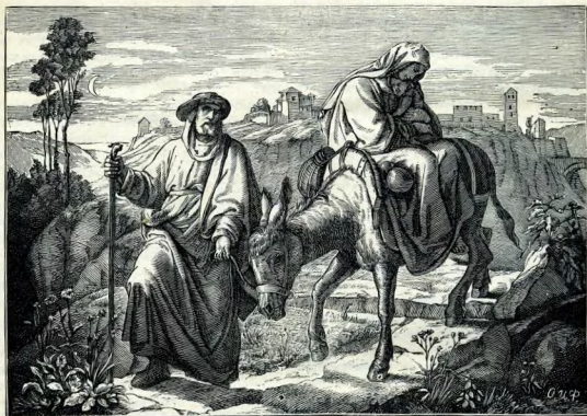
V. Бѣгство въ Египетъ.