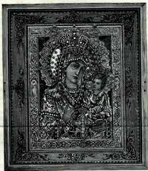
Грузинская икона Воешей Матери въ Красногорскомъ монастырѣ.