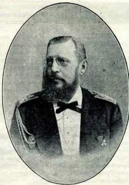
Вел. Князь Константинъ Николаевичъ.

Т ЯЖЕЛАЯ утрата, понесенная Императорскимъ Домомъ въ лицѣ Великаго Князя Константина Николаевича, преисполнена глубокою горестію сердца всѣхъ русскихъ людей. Многочисленныя заслуги, оказанныя почившимъ отечеству, на глазахъ у всѣхъ. Имя Великаго Князя находится въ тѣснѣйшей связи съ незабвенной эпохой великихъ преобразованій во внутренней жизни нашего отечества. Великій Князь былъ правою рукою Царя-Освободителя во всѣхъ его безсмертныхъ зачатіяхъ, посвятивъ все свои силы на разработку тѣхъ живительныхъ началъ, которыя были положены въ основу этихъ зачатій, и энергически преслѣдуя приведеніе ихъ къ полному и восторженному осуществленію. Освобожденіе крестьянъ,